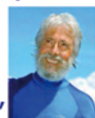
Jean Michel Cousteau