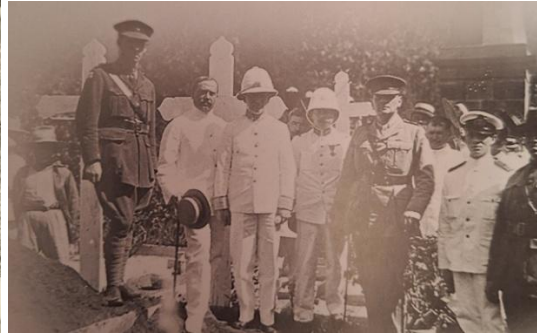
Le gouverneur et notables des EFO et officiers ANZAC