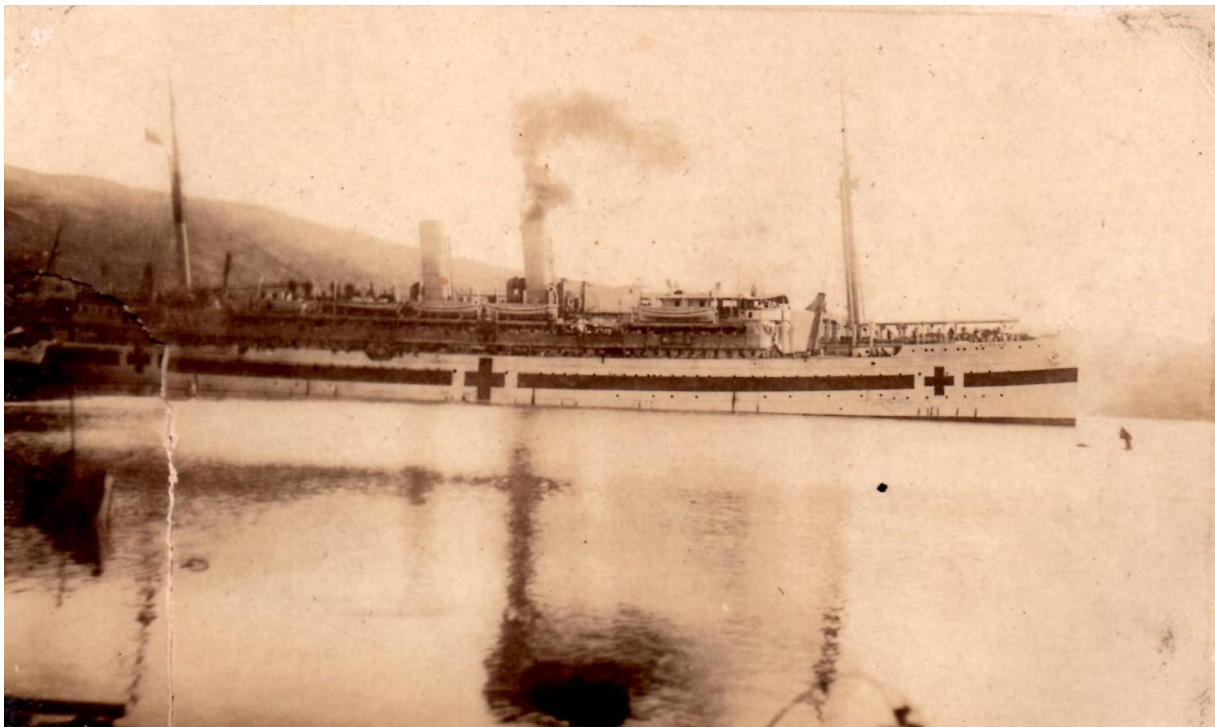
Le Maheno en rade de Pape'ete.

Le mercredi 5 septembre 1917, à deux heures de l'après-midi, le navire-hôpital NZ HS Maheno mouille dans la rade de Papeete. Le paquebot, propriété de l'Union Steam Ship Company , arrive directement de Bristol après une escale à Panama. À son bord, les blessés d'Ypres, de Messine et d'Armentières.